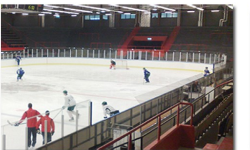
Ishockey sargar & tillbehör