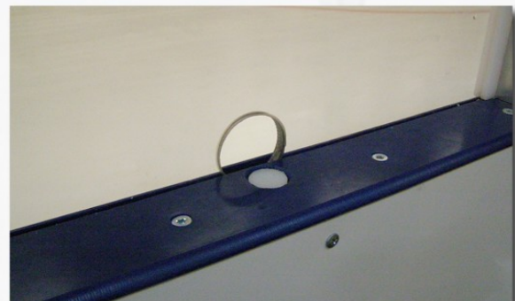
Båsdörr med öppningsknapp från issidan