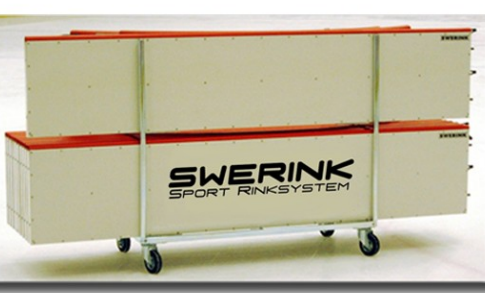
Knatte Hockey avdelare