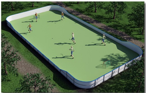
Outdoor Arena High