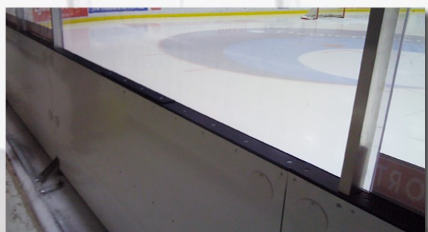
ABB Arena Västerås. Isolerad & klädd baksida