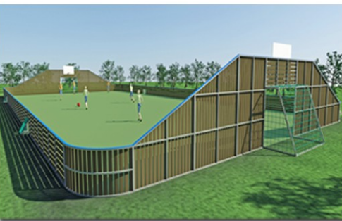
Spontanidrottsarena woody låg