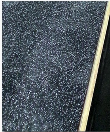
Gummimattor för bås & kringtytor