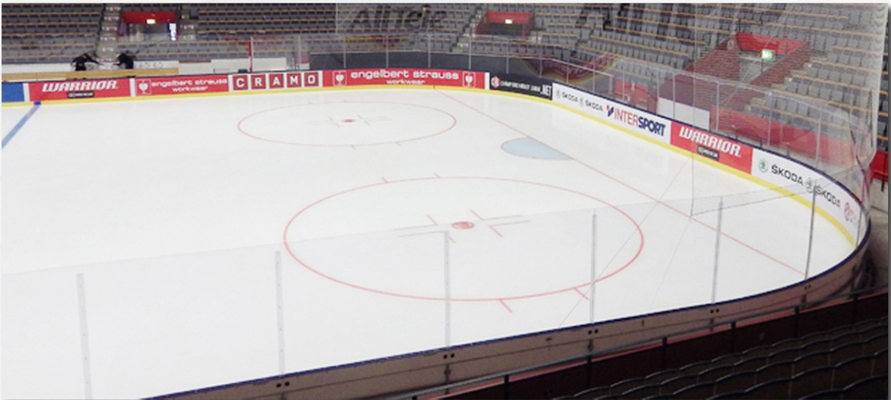
SAAB Arena Linköping. SHL

En av marknadens mest säkra sargar hittar Ni här hos oss, en sarg med integrerade stolpar i sargen vilket gör att publikskyddet hamnar väldigt långt fram på sargen vilket markant minskar skaderisken vid "checking from Behind"