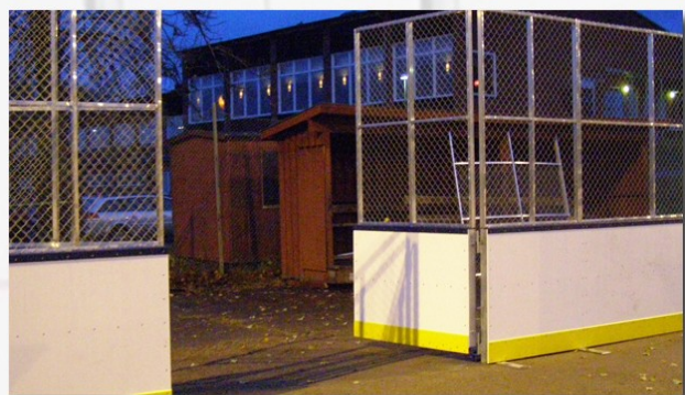
Utebana med dubbelbladig serviceport