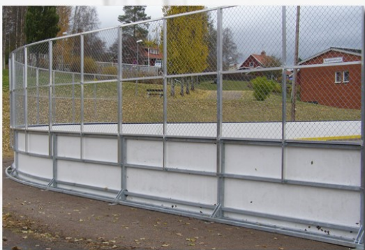
Utebana med nät & grusstöd