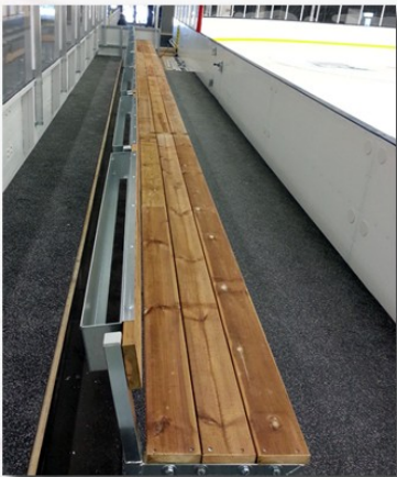
Spelarbås med bänk, coachwalk & flaskhållare

Egentillverkade spelarbåsar med tillbehör som håller hög kvalité.