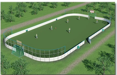
Näridrottsarena plastic 5,5 radie