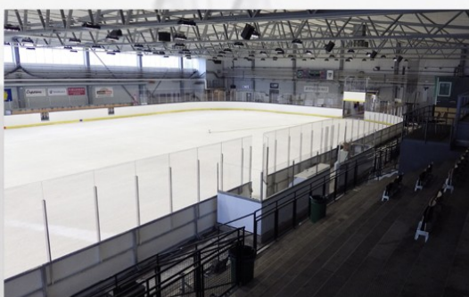
Stora Mossens ishall Bromma