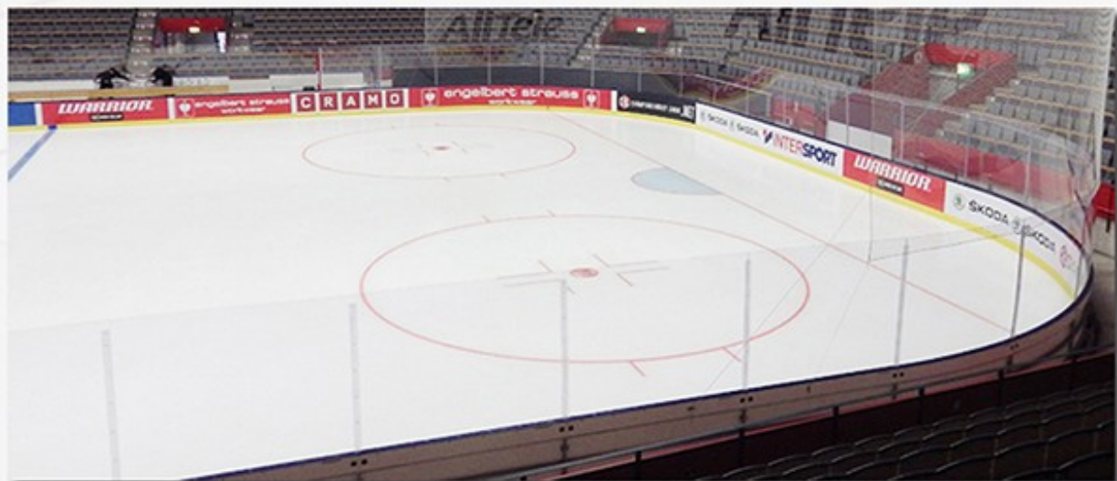
SAAB Arena Linköping. SHL

Sargen har en höjd på 1070 mm räknat från isytan ( 30 mm ) och är placerad på en 30 mm hög icedamm som möjliggör enkel demontering då arenan skall användas till annat än hockey.