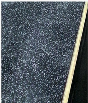
Gummimattor för bås & kringtor