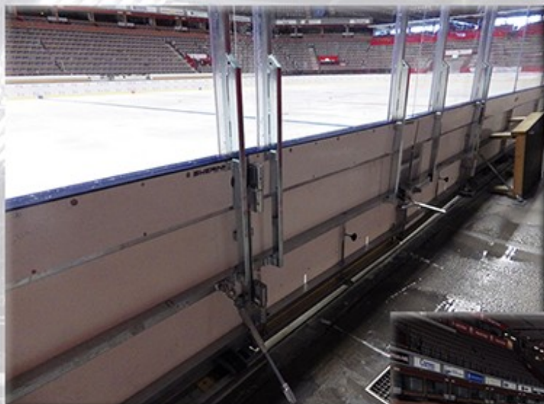
Stolpar krävs på serviceport & båsdörrar