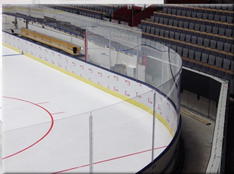
Täcklistor mellan publikskydden av transparent polykarbonat

Vår lösning på stolplöst publikskydd ger en otroligt bra upplevelse för publiken.